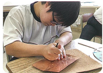
美術「銅板レリーフ」

校内・校外就業体験を行います。校外就業体験では、福祉事業所や企業で実習を行います。関係機関や地域の方々の協力を得ながら働く力や生活する力を高めていきます。