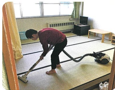
日常生活「掃除機がけ」