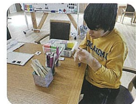
就業体験 (生活介護事業所)