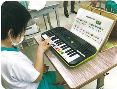
音楽「かえるのがっしょう」

生活に密着した目標や課題に沿って学習を展開しています。実際の体験の中から、生活に必要な知識や技能を身に付けていきます。