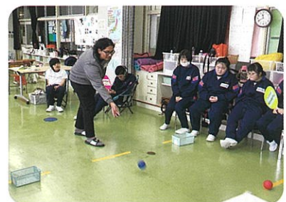
総合的な探究の時間 「外国の方と交流をしよう」