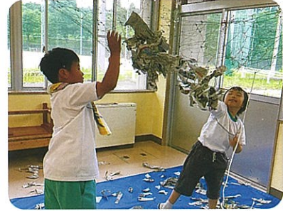
遊びの指導「新聞紙で遊ぼう」