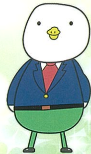
しらとり支援学校 マスコットキャラクター 「しらとりくん」