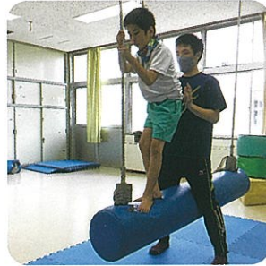
自立活動 身体の動き 「揺れ遊具に乗ろう」