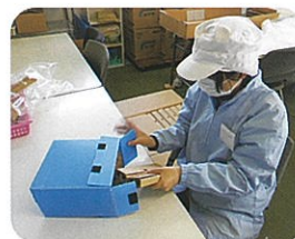
就業体験 (就労継続支援A型事業所)